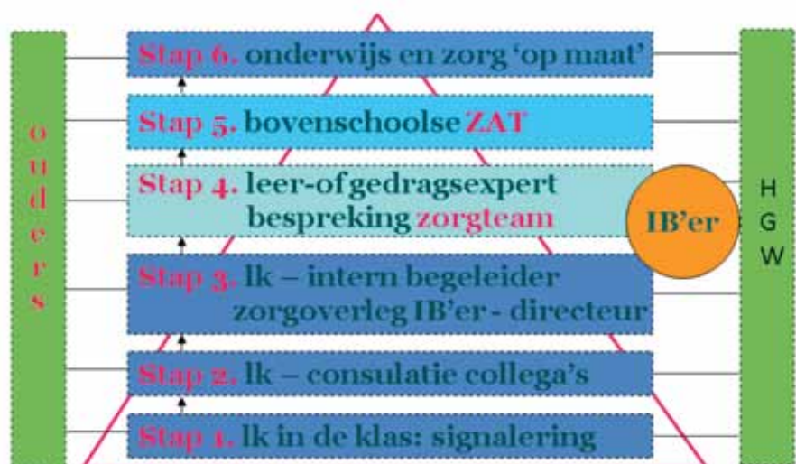
Figuur 2. Combi OZR + HGW in 6 stappen (afgezet tegen de piramide leerlingpopulatie en zorg en zorgbehoefte)

De leerkracht werkt handelingsgericht. Hij doet interventies naar aanleiding van eigen observaties en (toets)resultaten. Interventies in deze stap: voor- of ver- lengde instructie, (kleine) aanpassingen in standaard leerstofaanbod, investeren in een goede relatie met iedere leerling. De leerkracht heeft met de ouders gesprek- ken over ontwikkelingen van hun kind én HGW.